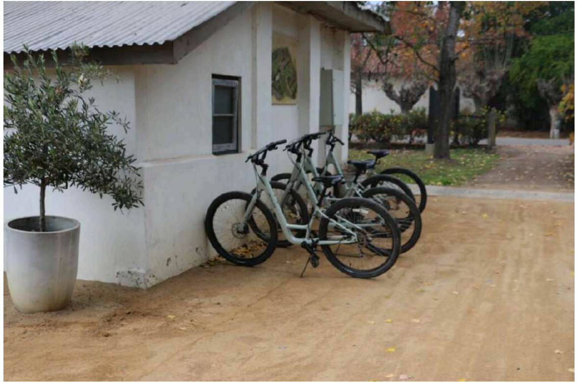
Paseos en E-Bikes

Instagram: @viumanentwinery Sitio web: www.viumanent.cl