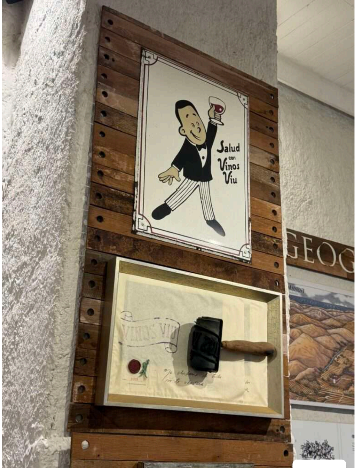
Antigua publicidad Vinos Viu