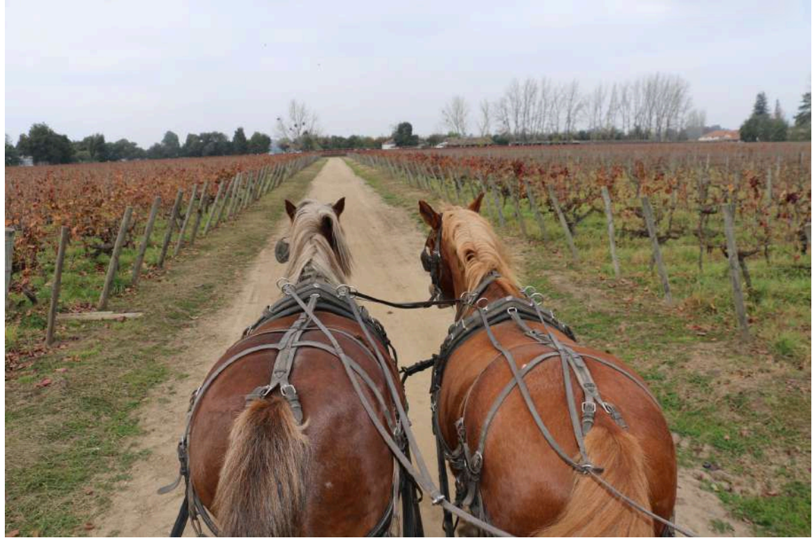
Paseo en carruajes