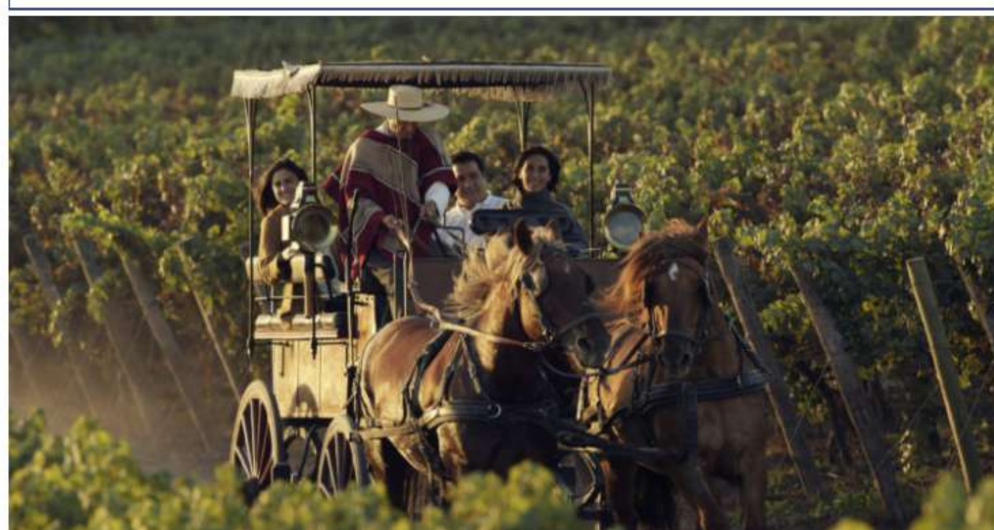
Viña Viu Manent