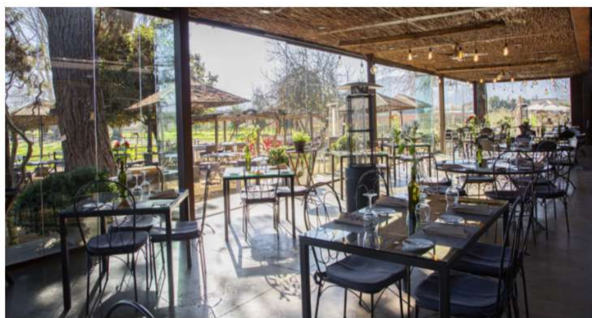
Viña Viu Manent

Para los amantes del vino, el clásico Tour en Carruaje les invita a dar un paseo por los bellos viñedos en un coche tirado por caballos, que incluye la degustación guiada de cinco vinos, mientras que el Tour Ícono entrega una experiencia privada y personalizada para conocer los vinos de alta gama de la viña.