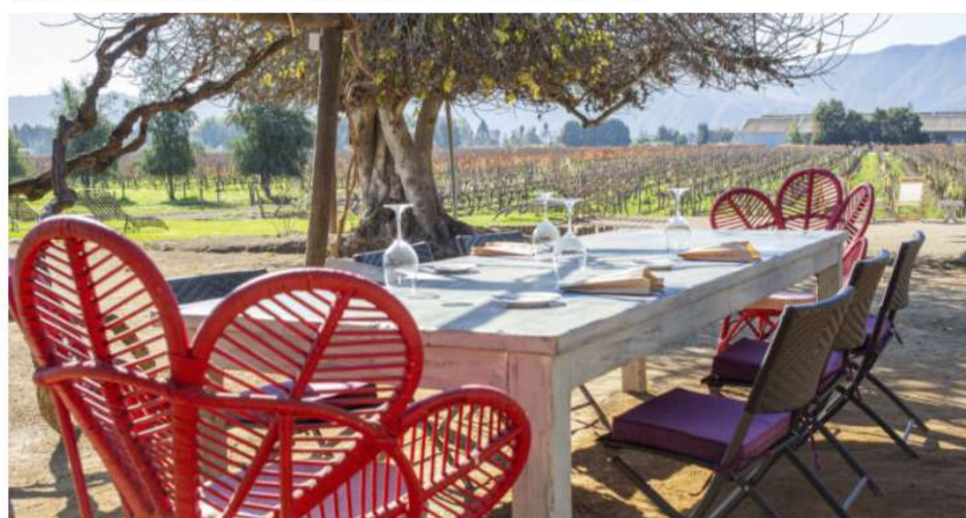
Viña Viu Manent

Las actividades al aire libre son una de las grandes atracciones de la viña, donde los visitantes pueden disfrutar de la belleza natural del Valle de Colchagua. Dentro de ellas, destaca el E-bike Tour , el cual permite experimentar un paseo guiado por los caminos interiores de los viñedos en bicicletas eléctricas, disfrutando de hermosas vistas a la cordillera de los Andes y a los cerros de Apalta.