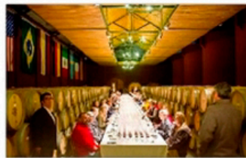
Los invitados se reunieron en la sala de barricas de la bodega de Viu Manent en la Sala Trayectoria, donde probaron cosechas antiguas y una vertical de Vía 1.